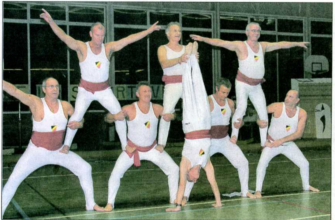
Une évocation des premiers gymnastes, la pyramide humaine.

Ce qui se faisait habituellement à l'époque. Plus tard, une autre